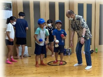
老人クラブ会長に教えてもらい ペタンクに挑戦🔄