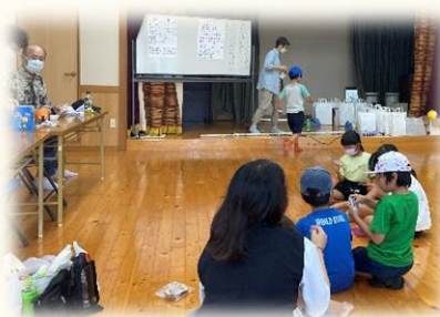
最後はビンゴ大会! ビンゴになると豪華賞品ゲット🔄