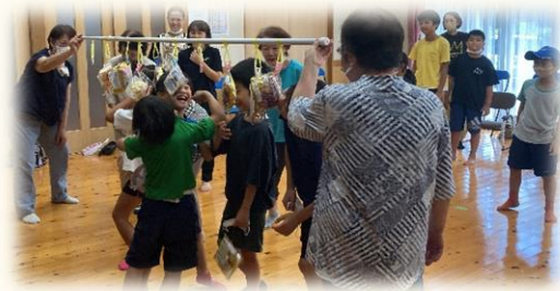
20年以上前から恒例のパン食い？取り？競争 自分の好みのパンをめがけて一直線!!