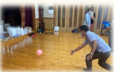
自治会長も子どもたちと一緒に ペットボトルボーリングに挑戦🔄

久しぶりの多世代交流、とても楽しい。 この子たちのお父さんたちも参加していた。 普段は挨拶程度の関わりだけど、こうやって 交流すると普段からの声かけもしやすくなる。 今後も続けていきたい大事な行事。 私たちも元気をもらおう。まだまだ頑張りたい。